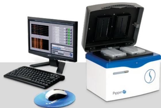
Pippin Prep HT