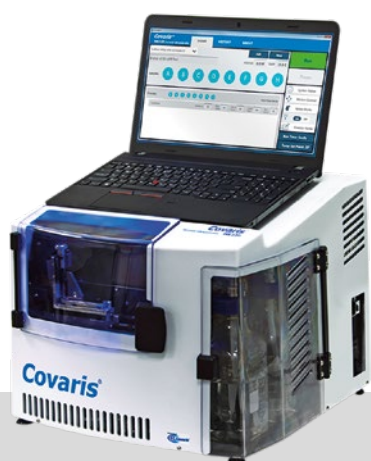
ME220 throughput semi- automatico (processamento sequenziale fino a 8 campioni)