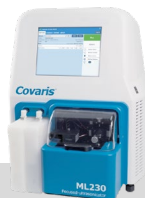
ML230 throughput semi- automatico (processamento simultaneo di 8 campioni con trasduttore lineare)