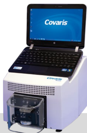
M220 throughput a singolo campione